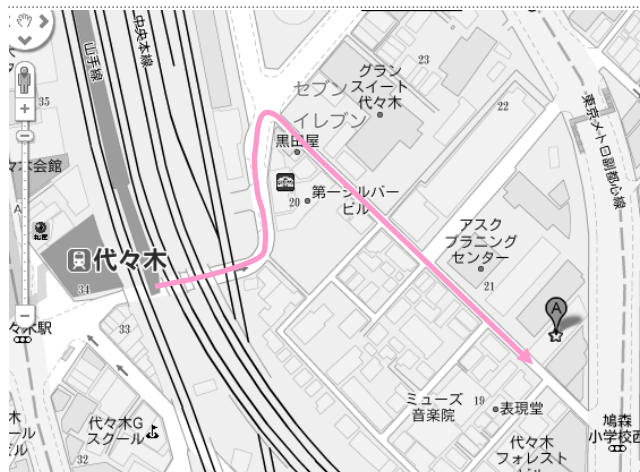
※JR 代々木駅東口より徒歩3分 (プラザF1ビル 8F)